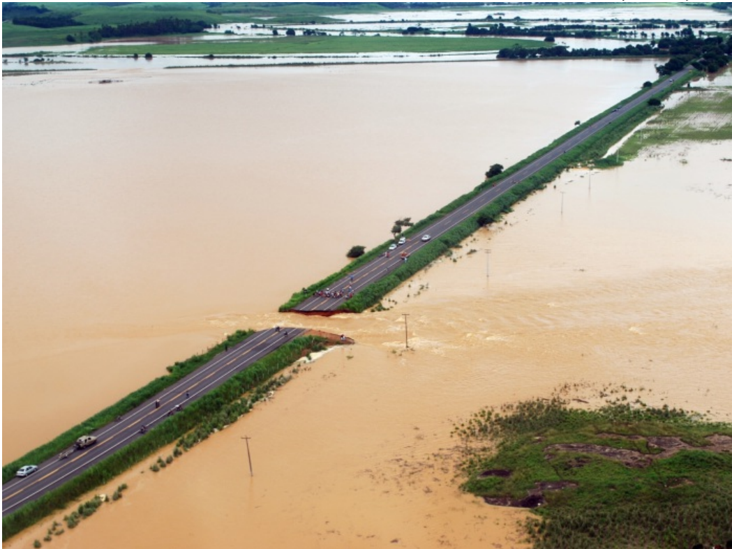
Nível do rio Muriaé, que fez ceder parte da BR-365, que liga Campos a Itaperuna, volta a baixar